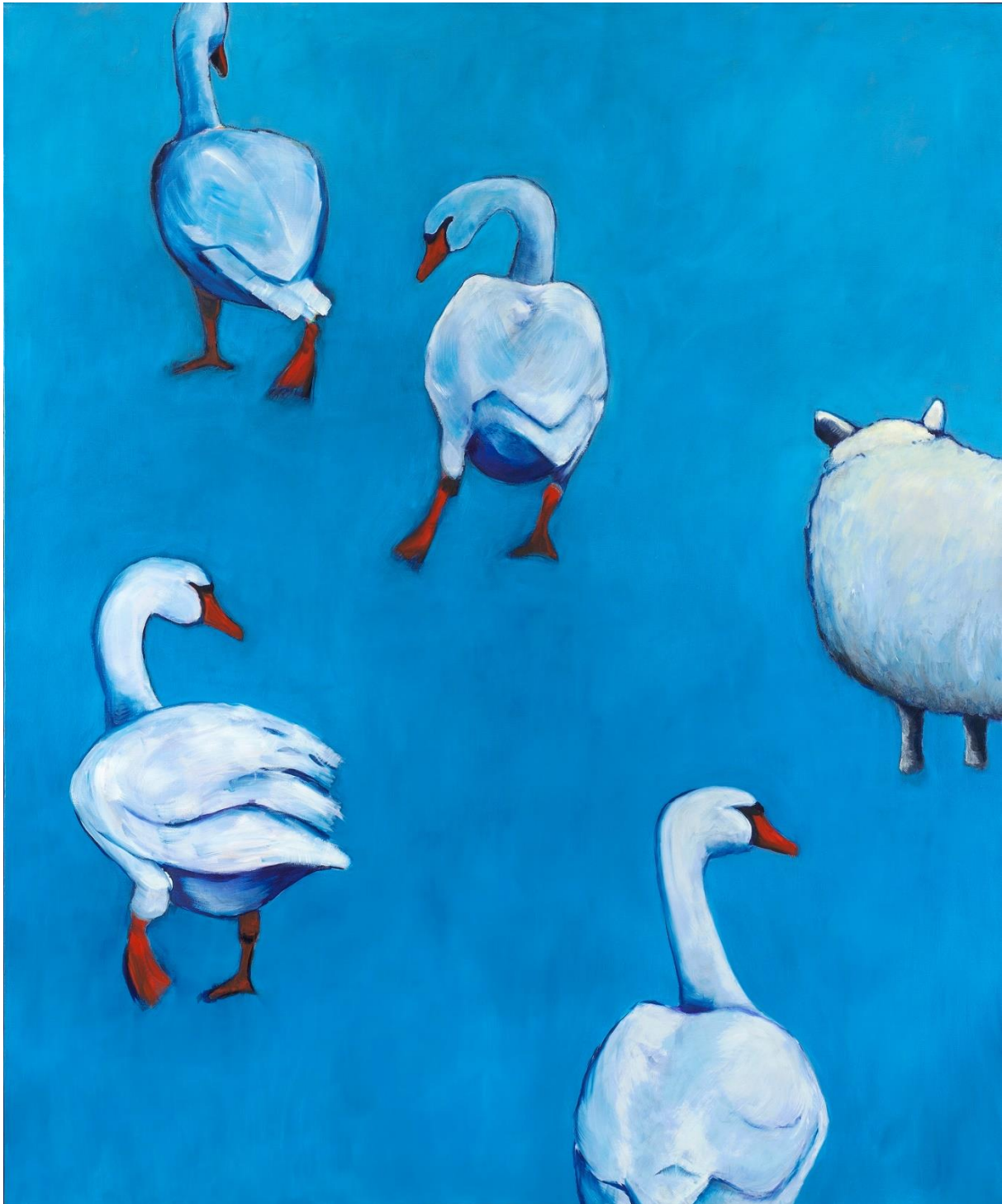
Beeld uit expositie 'Een dier is ook maar een mens'. Eppie Dam ziet Janine van Zeeland. Juni-augustus 2023 Museum Dokkum